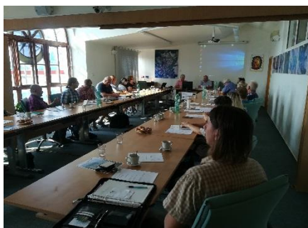
Členská schůze Mikroregionu Novoměstsko

volně ke stažení na webových stránkách www.novomestsko.cz .