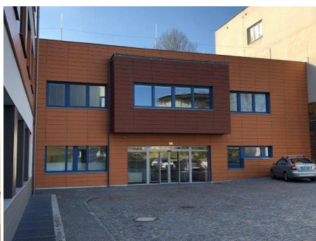
Slavnostní otevření dětského oddělení nemocnice Nové Město na Moravě